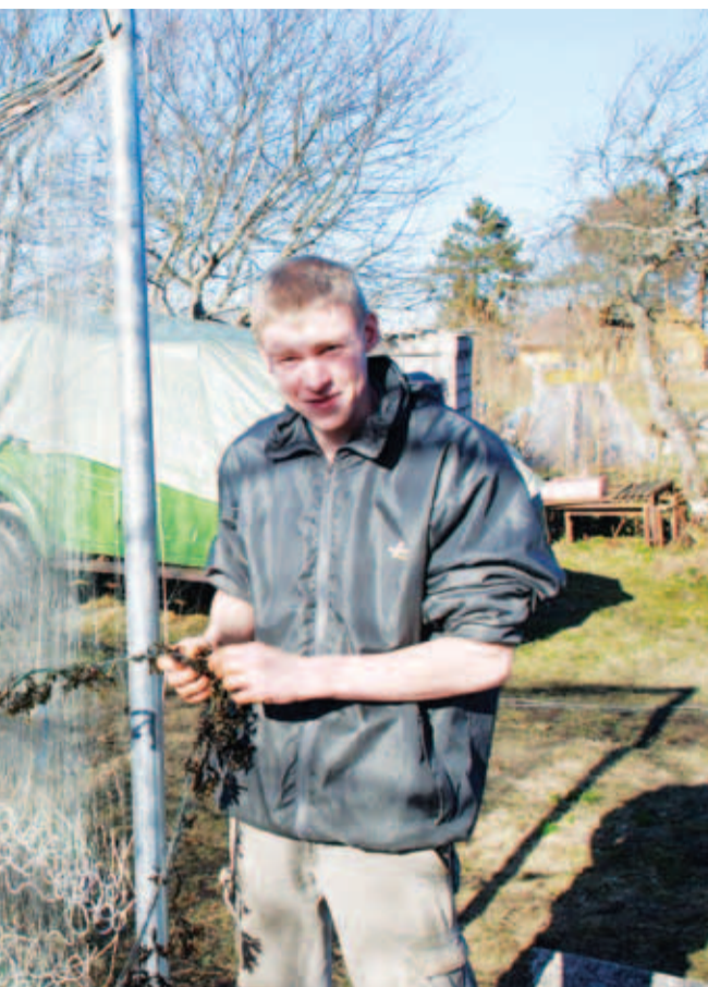
...e puhastamas, põhitöökoht on tal aga Kiiul, autoteeninduses.