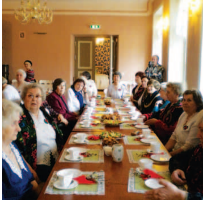
Pidulik kohvilaud Kostivere Kultuurimõisas.

Pika laua peal olid ootamas kuum kohv ja eakate endi valmistatud soolased ja magusad suupisted. Peagi kõlasid Pihlakobara ansambli kaunid laulud kodupaigast ja kodumaast. Rõõmu pakkusid ka särtsakad tantsumüürid, mis panid saali rõõmsalt helisema. Teatritrupp mängis külakostiks oma etendust "Punased roosid". Jällegi oli publiku kaasaelamine ehe ja aplodeeriti tugevalt. Teatrikuu lõpetas Jõelähtme Lava Grupi esinemine 29. märtsil etendusega "Karu" ja "Abieluettepanek". Tore, kui sellised eten-