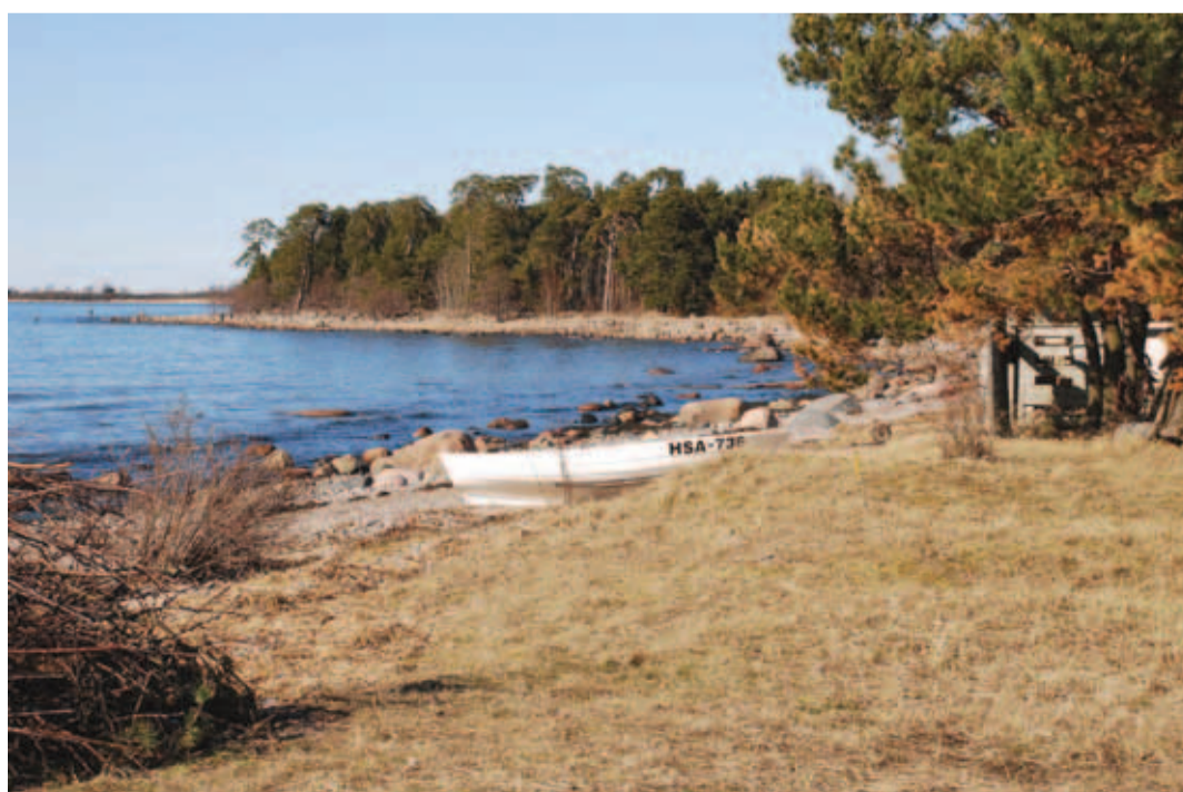
Paadid ootavad merele minekut.