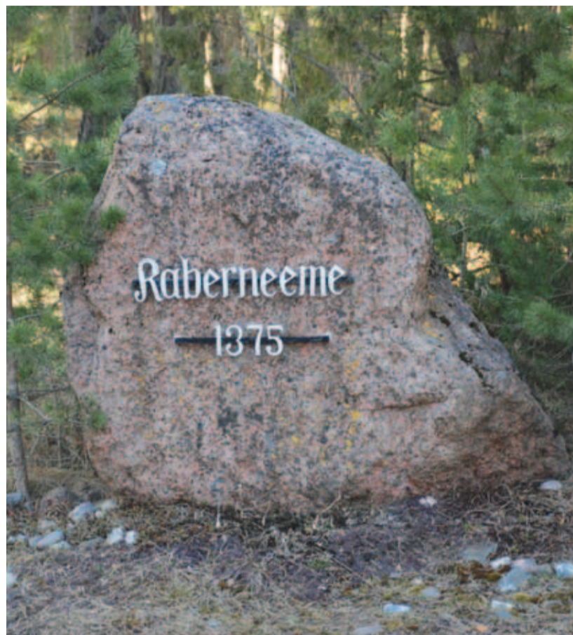
Kivi küla "väravas" tähistab Kaberneeme esmamainimise aastat.